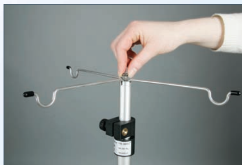
Enkel og ...