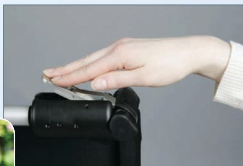
... rask montasje ...