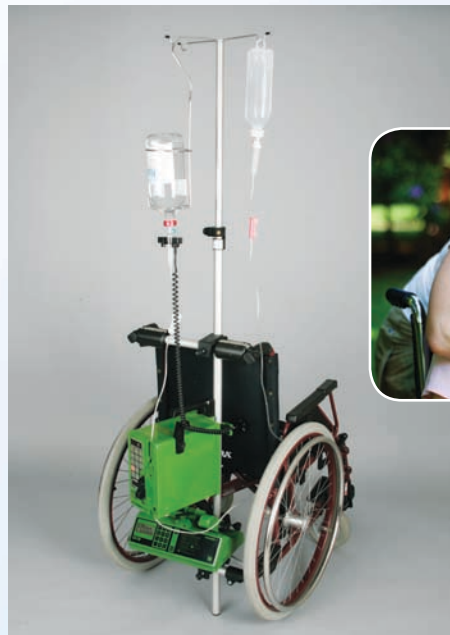
Exemplo de aparelhos que podem ser fixados

Com o auxílio do Sistema de fixação VARIOFIX® você pode fixar todos os aparelhos de abastecimento diretamente na sua cadeira de rodas. Você poderá locomover-se livremente sem o auxílio de terceiros VARIOFIX® aumenta a sua qualidade de vida e otimiza a flexibilidade no acompanhamento.