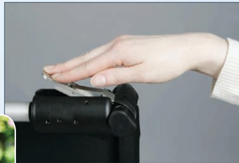
... e rápida...